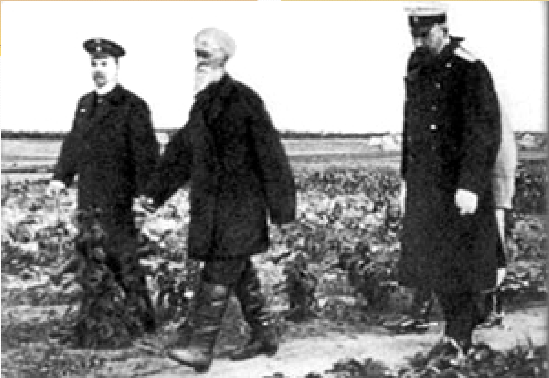
П.А.Столыпин осматривает хуторские огороды близ Москвы в апреле 1910 г.