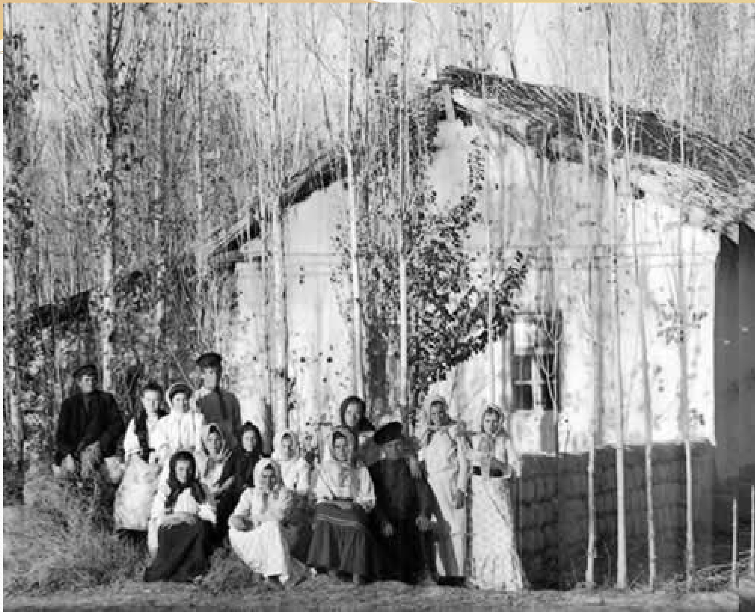
Русские переселенцы в Самаркандской губернии Туркестанского генерал губернаторства.