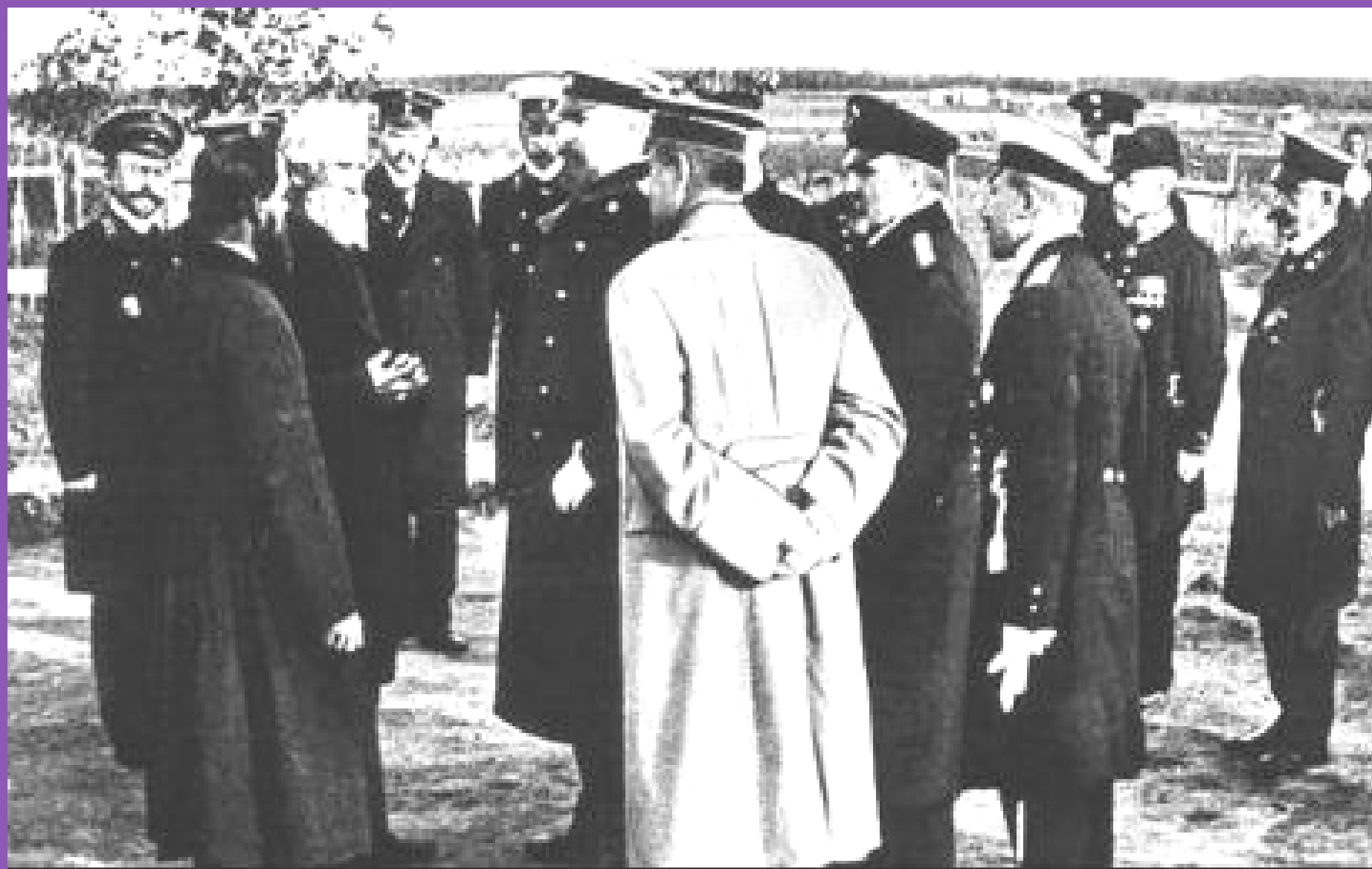
П. А. Столыпин в гостях у кулака.