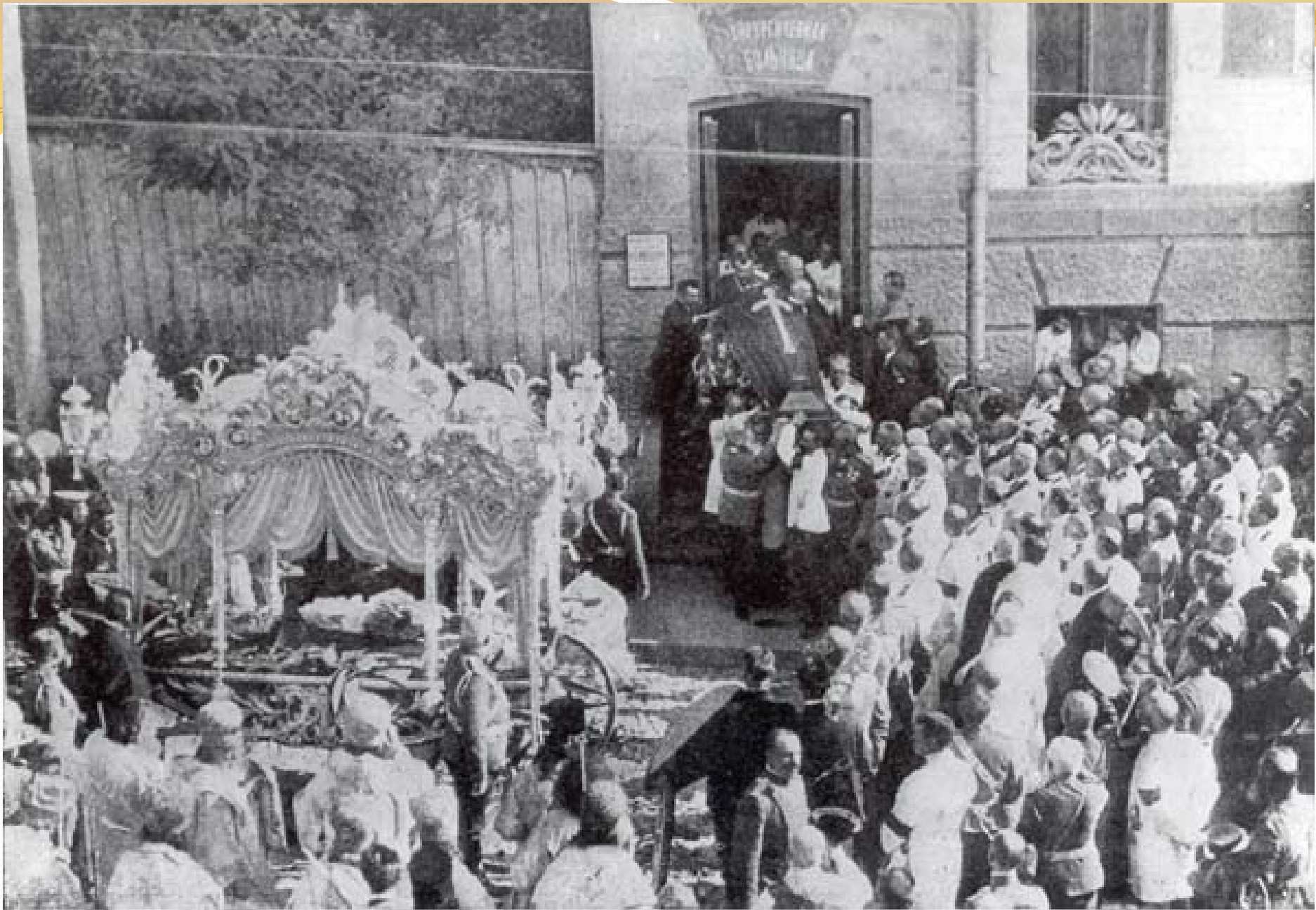
Винось тѣла П. А. Столыпина изъ больницы бр. Маковскихъ.