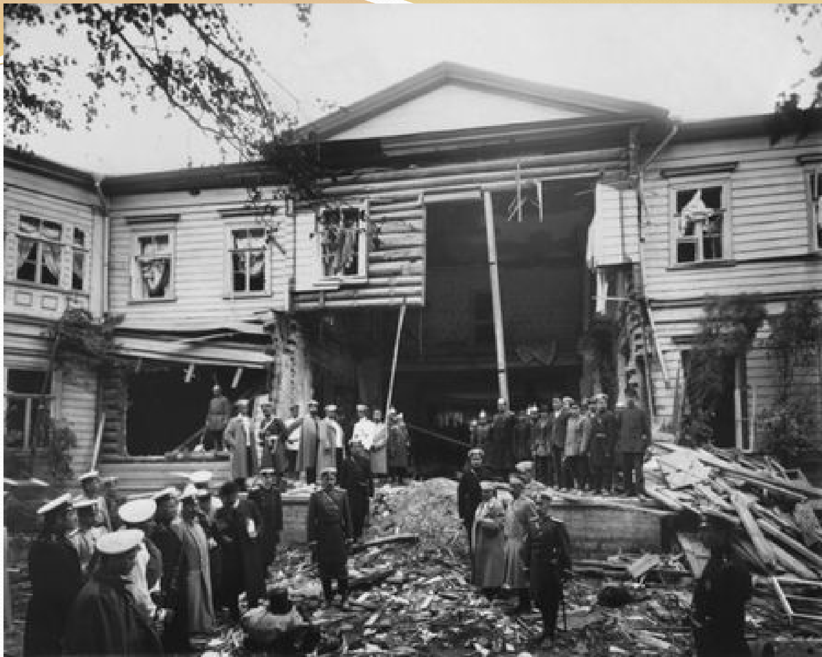
Дача Столыпина после взрыва. Август 1906 г.