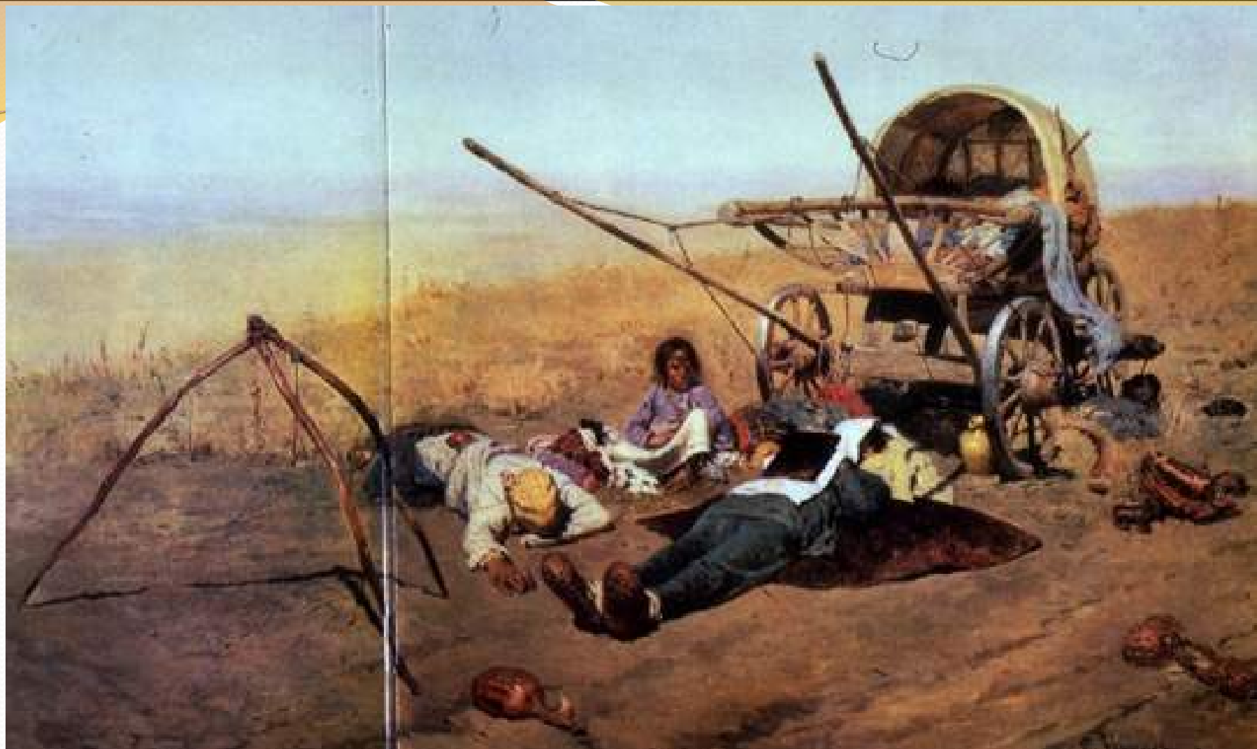
«В дороге...смерть переселенца»